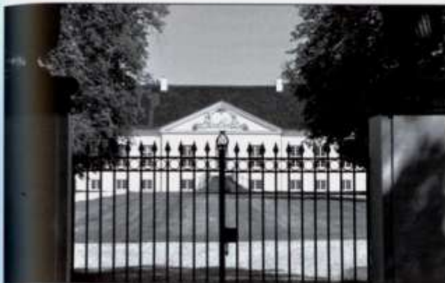
Turebyholm, der opslugte de 16 gårde i landsbyen Tureby (2011).