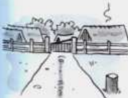
Måske er det sådanne grænsepæle, som Stavreby lå ved?

Sandby , Kirkeby, N (1268 Sandby). Sand + by; dvs. "Byen ved det sandede sted" (sandbakke). Jorden var dog ikke mere sandet end at en hvd. og en stor by kunne trives her (22 / 162,1).